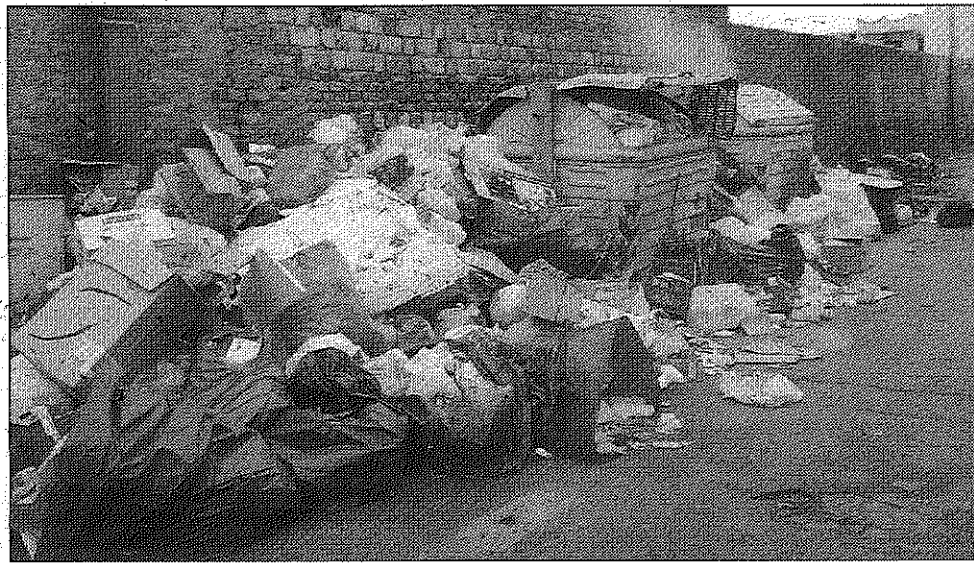
Cumuli di spazzatura bruciati lungo le strade di Melito Porto Salvo

«Come Movimento - hanno sottolineato - anche in questa occasione riteniamo indispensabile ribadire la necessità di garantire un costante rapporto informativo con la cittadinanza sullo stato dell'attività svolta e su argomenti di prevalente interesse pubblico come l'attuale emergenza rifiuti». «Esprimiamo - hanno concluso - vivo apprezzamento per l'attività condotta in questi giorni dal Corpo forestale dello Stato in relazione all'abbandono dei rifiuti sul greto della "Fiumara Tabacco". È indispensabile che questi comportamenti non si verifichino più e ci auguriamo al più presto si possa